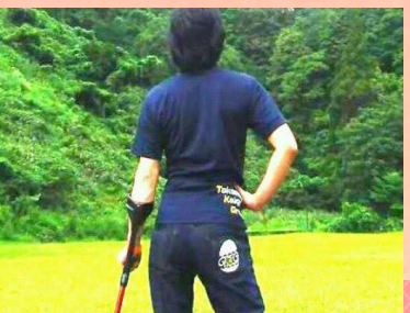
心侍！たなかいご殿