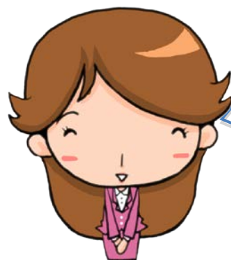
居宅介護支援専門員 （ケアマネジャー）