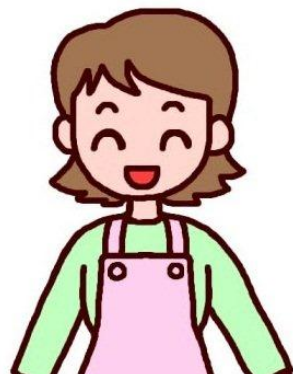
訪問介護（ヘルパー）